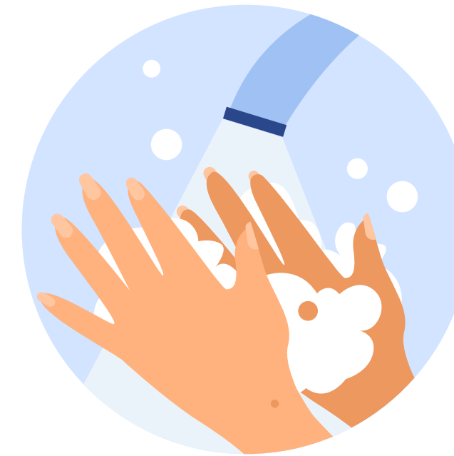
Миття рук з милом перед уроками

Керівник та засновник закладу освіти відповідає за те, щоб у медичному пункті були необхідні засоби та обладнання: безконтактні термометри, дезінфектори, антисептики для рук, засоби особистої гігієни та індивідуального захисту.