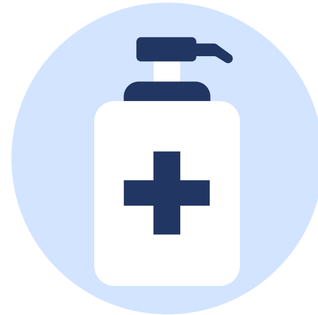
Дозатори для антисептиків